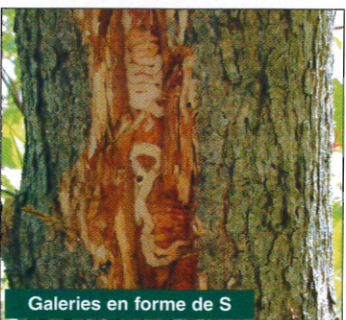
Galleries en forme de S