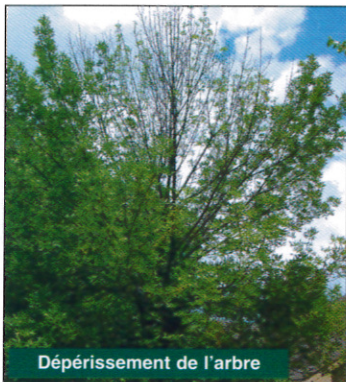
Dépérissement de l'arbre