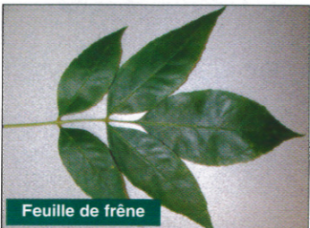
Feuille de frêne